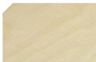
NATUREL SANS FINITON

Rendu quasiment imputrescible et d'une incroyable stabilité, le bois massif Accoya® se classe comme le bois le plus performant en terrasse.